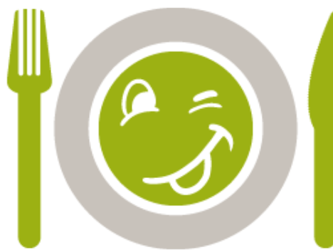
Paris - Ile-de-France

Le logo seul peut être utilisé comme pointeur sur une carte, et sur tous supports de communication nécessitant une présentation simplifiée du logo.